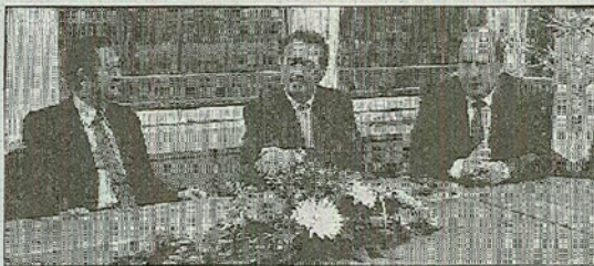
Nella foto la visita dell'ambasciatore della Corea del Nord Han Tae Song

Un'apertura che a Tavagnacco, dove è stato ospite dell'azienda Interna, è stata toccata con mano. L'ambasciatore Han Tae Song è arrivato a Udine alle